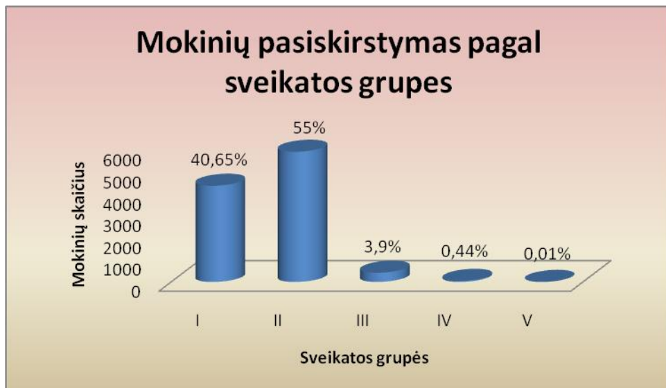
1 pav. Mokinių pasiskirstymas pagal sveikatos grupes

Antroji sveikatos grupė dominuoja moksleivių tarpe, vadinasi, daugiau negu pusė moksleivių (55 proc.) turi bent vieną sveikatos sutrikimą. 40,65 proc. moksleivių, iš visų patikrintųjų sveikata, yra visiškai sveiki, t.y. jie priskiriami pirmai sveikatos grupei. Panašus pasiskirstymas vyrauja ir tarp pirmokų (žr. 2 pav.).