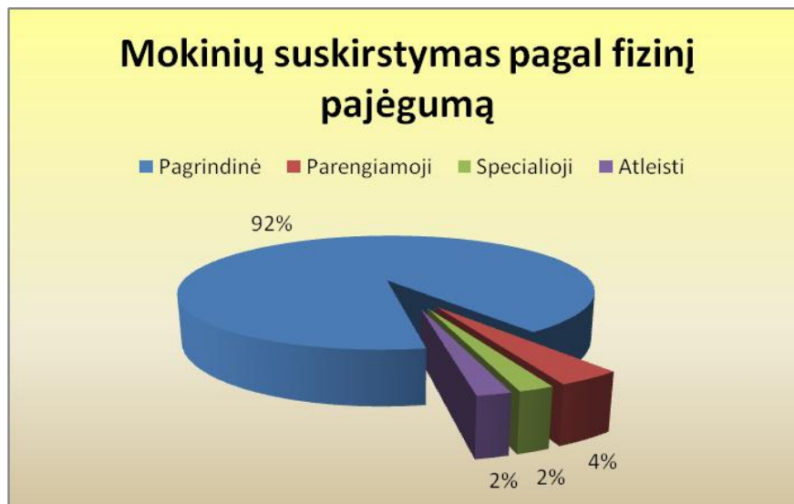
3 pav. Moksleivių pasiskirstymas pagal fizinį pasirengimą

Analizuojant moksleivių sveikatos sutrikimus, dažniausiai nustatomi regėjimo sutrikimai, kurie sudaro 50,8 proc. (3 254 atv.) iš visų patikrintusių sveikatą mokinių. Gana daug mokinių turi skeleto-raumenų sistemos sutrikimų 34,7 proc., į kuriuos įeina ydinga laikysena, skoliozė, bei kiti susirgimai (žr. 4 pav.).