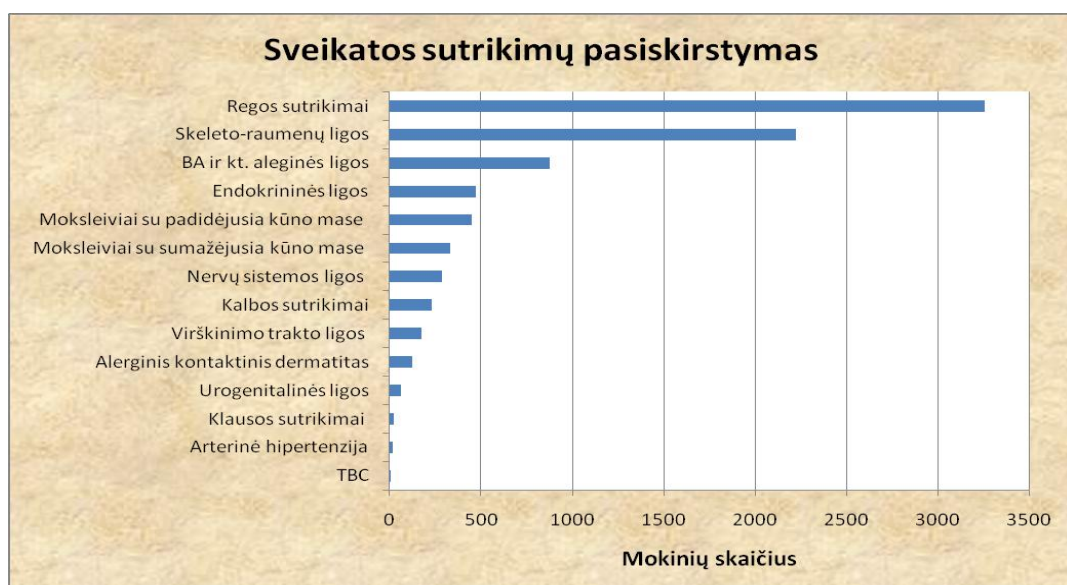
4 pav. Moksleiviams nustatytų sveikatos sutrikimų pasiskirstymas

Analizuojant moksleivių sveikatos sutrikimus, dažniausiai nustatomi regėjimo sutrikimai, kurie sudaro 50,8 proc. (3 254 atv.) iš visų patikrintusių sveikatą mokinių. Gana daug mokinių turi skeleto-raumenų sistemos sutrikimų 34,7 proc., į kuriuos įeina ydinga laikysena, skoliozė, bei kiti susirgimai (žr. 4 pav.).