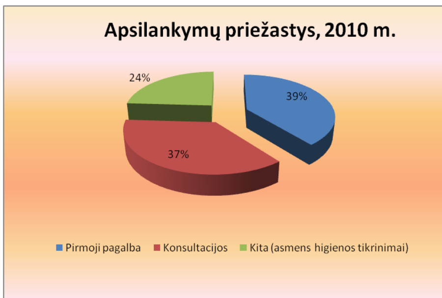
5 pav. Apsilankymų pas visuomenės sveikatos specialistą priežastys