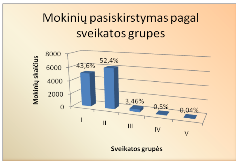
1 pav. Mokinių pasiskirstymas pagal sveikatos grupes

2009 metais profilaktiškai sveikatą patikrino 97,2 proc. mokinių, iš jų pirmokai – 99,8 proc. (tik 1 pirmokas nebuvo patikrinęs sveikatos). Pagal sveikatos grupes mokiniai pasiskirstė taip (žr. 1 pav.):