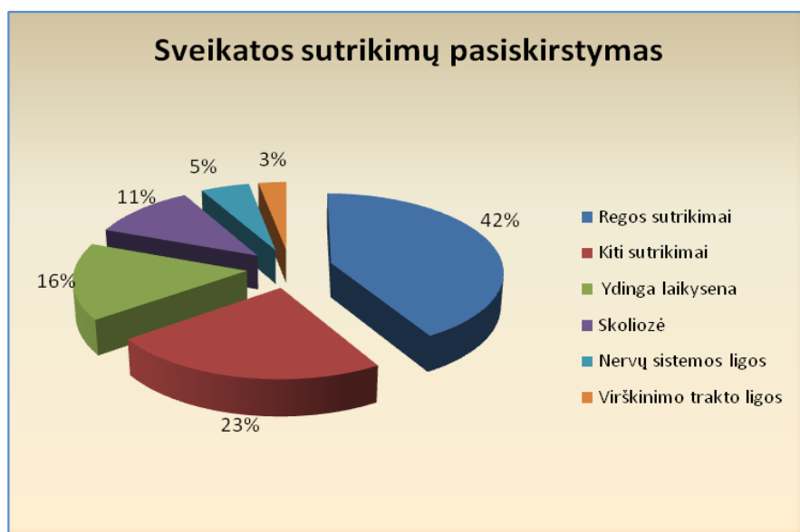
3 pav. Sveikatos sutrikimų pasiskirstymas

Profilaktinių patikrinimų duomenys rodo, kad dažniausiai yra diagnozuojami regėjimo sutrikimai – 3 044 vaikams, kas sudaro 42 % visų sutrikimų, ydinga laikysena – 1 154 mokiniams (16 %) bei kiti susirgimai – 1 715 mokinių (23 %), į kuriuos įeina bronchinė astma ir kitos alerginės ligos, taip pat skeleto-raumenų ligos, klausos ir kalbos sutrikimai. Mokiniais, ypač pradinukams, yra dažnai nustatomi kalbos sutrikimai (202 atvejai tarp visų pasitikrinusių). Daugėja mokinių ir su klausos sutrikimais (42 atvejai) (žr. 3 pav.).